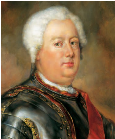
Friedrich Wilhelm I., 1713–1740