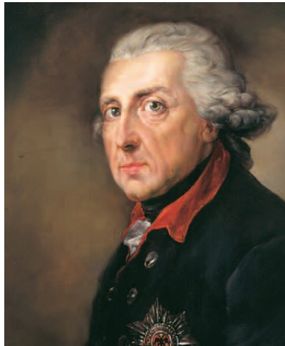
Friedrich II. (der Große), 1740–1786