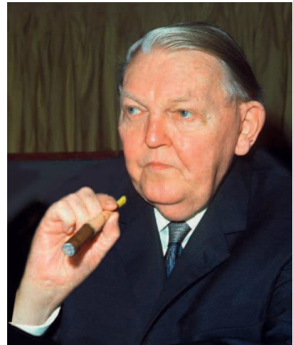
Ludwig Erhard, 1897–1977